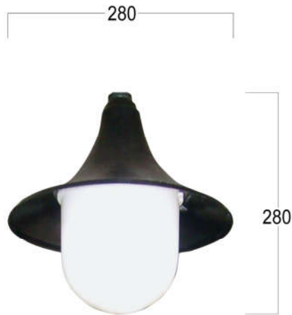
Nguồn sáng Luminaire