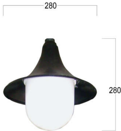
Nguồn sáng Luminaire