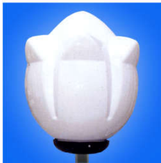
Đèn Hoa Sen 250 Lotus-shape lamp 250